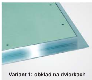
Variant 1: obklad na dvierkach