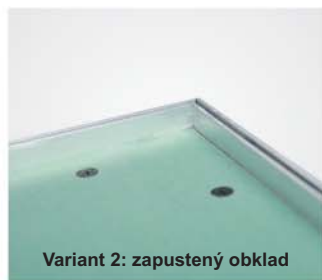
Variant 2: zapustený obklad