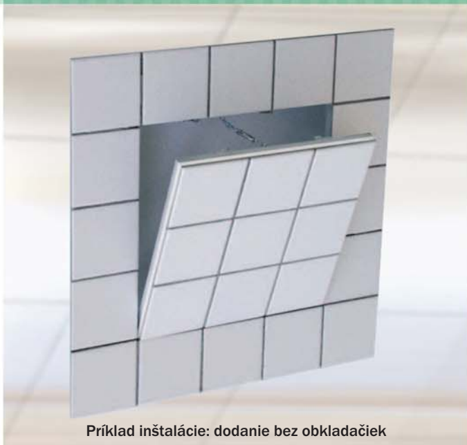
Príklad inštalácie: dodanie bez obkladačiek