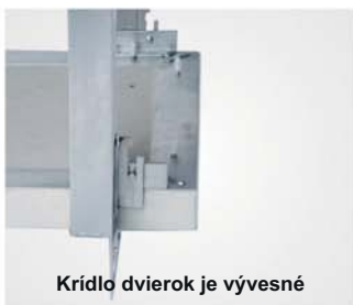
Krídlo dvierok je vývesné

Revízne dvierka pozostávajú z hliníkových profilov so sadrokartónovou výplňou Fireboard v hrúbke 30 mm (2 x 15 mm). Obidva rámy revíznych dvierok sa skladajú zo štyroch rámových častí, ktoré sú navzájom pevne spojené špeciálnym zváraním. Revízne dvierka sú vybavené poistnými úchytmi. Aby sa zabránilo prípadným úrazom, po každom otvorení dvierok sa úchyt musí znovu zaistiť. Medzi rámom a krídlom dvierok je vzduchová medzera 2,5 mm, ktorá je po obvode vyplnená protipožiarным (napeňovacím) tesnením. Revízne dvierka sa otvárajú stlačením neviditeľných zacvakávacích zámkov.